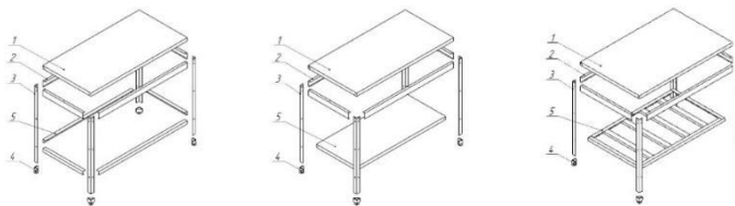
Схема сборки столов серии «Профи»

Схема сборки столов серии «Эконом», «Стандарт», «Стандарт+»